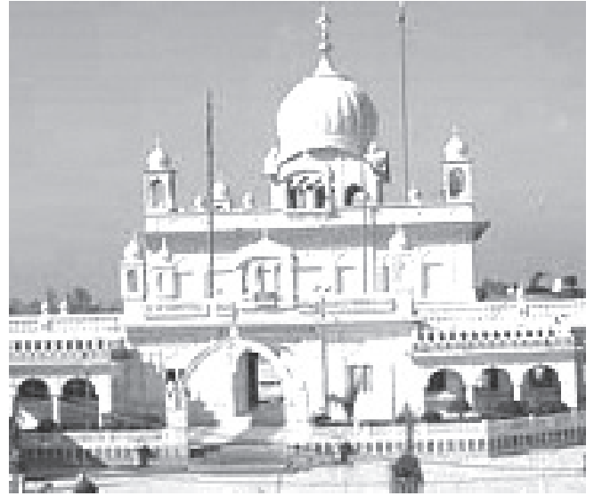
Gurdwara Khadur Sahib, Distt. Amritsar, built in memory of Guru Angad Sahib

Two anecdotes from the Sikh history prove this aspect of Bhai Lehna's character. In the first one, when Bhai Lehna came to Kartarpur second time, Guru Nanak was working in his fields. Guru Nanak prepared bundle of grass for his cattle. Bhai Lehna presented himself to serve. Bhai Lehna picked up the bundle of grass on his head. The bundle of grass was muddy. The muddy water drops dripped on the new clothes of Bhai Lehna. When Bhai Lehna reached Guru Nanak's house, Mata Tripta asked Guru Nanak to look at the clothes of Lehna which had been spoiled with mud. Guru Nanak replied that it was not mud, but saffron, making him as God's own elect and God founded him fit to carry the burden of humanity.